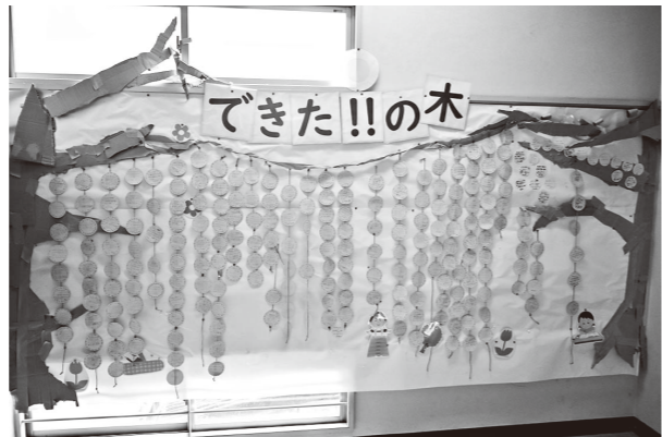
▲「できた!!」を集めた校内掲示物

保護者や地域と教職員が同じ思いで、子どもたちの自己肯定感を育てていけたらと思っています。ご家庭や地域で、子どもたちの前向きな姿が見られた時には、見逃さず「すごいね!」の言葉をよろしくお願いいたします。