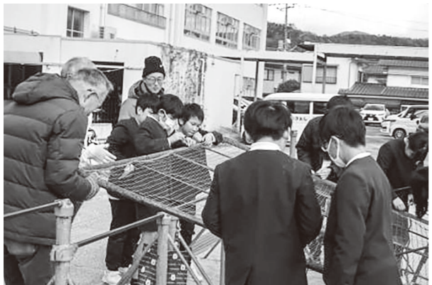
▲校内設備の修繕の様子

また、CS委員会の児童が考えた「学校のことを知っていただく」企画では、一緒に合奏や縄跳びを行いました。参加者からは、「顔見知りになり、会話が生まれてうれしい。」「また来てねと言われ、やりがいを感じる。」といった声が寄せられています。これからも、地域のみなさんと共に子どもたちの成長を支える学校づくりを進めてまいります。本年度もどうぞご協力をよろしくお願いいたします。