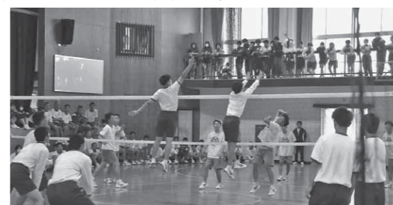
▲男子生徒による白熱したバレーボール 熊野高等学校 ☎854-4155

天候が心配されましたが、なんとか全ての日程を終了することができました。実施後のアンケートでは「みんなと協力できて楽しかった」「クラスが仲良くなれた」といった感想が数多く寄せられました。次回が楽しみです。