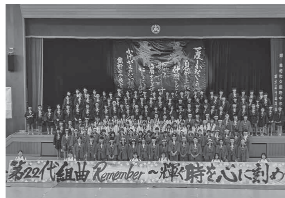
▲「組曲 筆の都くまの」を披露した生徒たち (教育総務課)

書かれた文字からは、中学校で過ごした時に心に刻み、夢に向かって仲間との絆を大切にしながら未来に羽ばたいていくという生徒の決意が伝わり、観客を魅了しました。