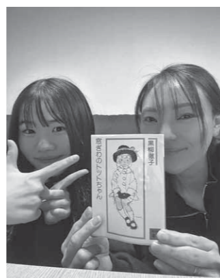
(教育総務課 社会教育グループ)

この本を読んで、現代においても1番大切な事を教えて貰いました。トットちゃんのお母さんや校長先生のように、私も常に柔軟で子どもの心に寄り添える人間でありたいです。