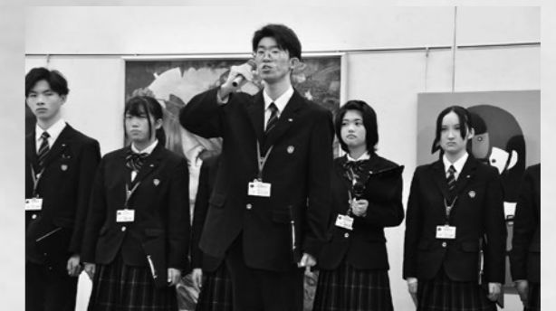
▲美術コース作品解説・講評会の代表挨拶の様子