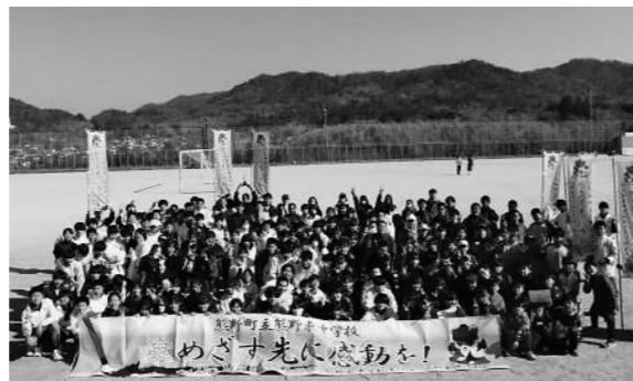
▲第3回あずぼん駅伝大会参加者

大会を盛り上げていただいた地域の皆様には心から感謝いたします。今後とも本校の教育活動へのご協力をよろしくお願いいたします。