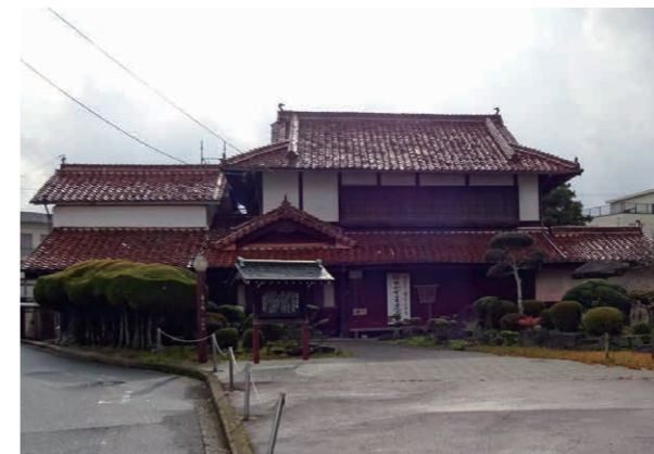
▲老朽化した郷土館