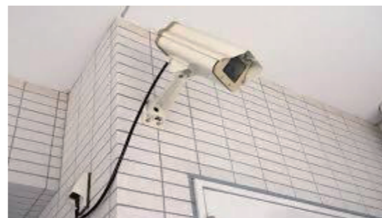
▲当初見込みを大幅に上回る申請がありました。