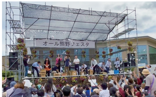
▲三重県熊野市で行われたオール熊野フェスタ

三重県熊野市に中学生を派遣し交流を深めることや、イベント等に出向き熊野町のPRをしている。