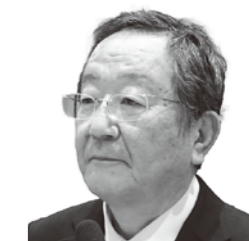
大瀬戸 宏樹 議員