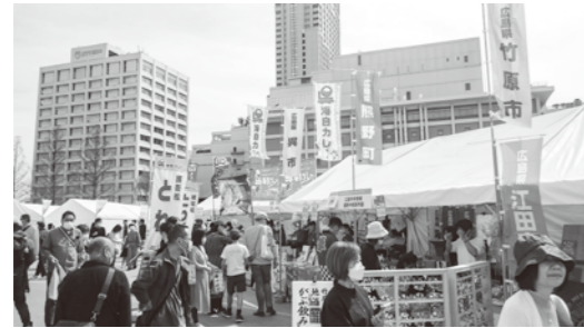
▲広島中央地域連携中枢都市圏事業 (1,353万円)