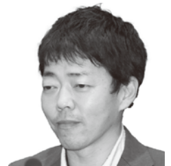
藤本 健太 議員