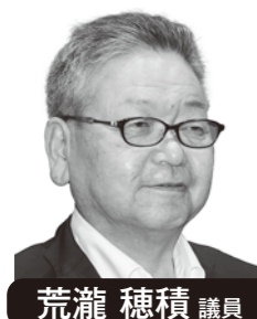
荒瀬 穂積 議員