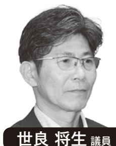
世良 将生 議員