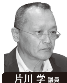
片川 学 議員