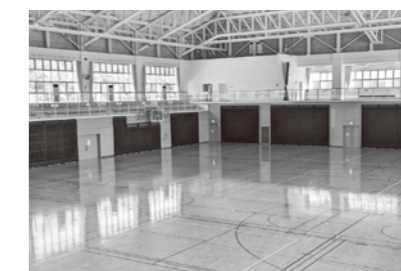
▲輻射式冷暖房を設置している体育館