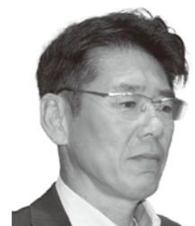
水原 耕一 議員