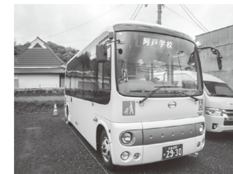
▲朝・夕の阿戸線バス