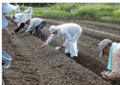
▲特産品化をめざし丹波種黒豆の作付に励む

Q 課題や悩みごとなどありますか。 A 会員の平均年齢が74歳と高齢化が進んでいます。後継者づくりも課題です。若い人の参加を待っています。女性も大歓迎です。