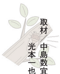
取材 中島数宜 光本一也

Q 今後の活動などを教えてください。 A 4月から憩いと語らいの場「きららサロン」を開設しました。おいしいコーヒールを入れてお待ちしています。