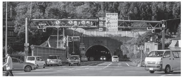
▶広島熊野トンネル

【Q2】 今年度の県道矢野安浦線バイパス延伸予算はいくらか。 【A2】 県の当初予算として1億4,200万円が計上されている。