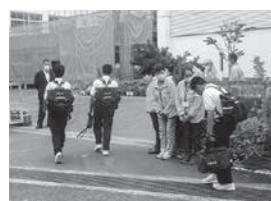
▲民生委員あいさつ運動

【Q3】 観光客が増えると筆の里工房周辺までの交通手段の確保も必要になってくる。考えは。 【A3】 筆の里工房周辺までは、最寄りのバス停から距離が遠く長年の課題である。現在は熊野営業所からタクシーを利用して行くよう案内しているが、今後来場者が増えれば新たな考えも必要となってくるので、調査研究していく。