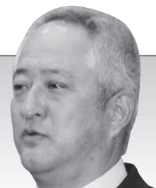
福垣内 邦治 議員