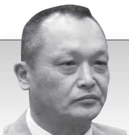
片川 学 議員