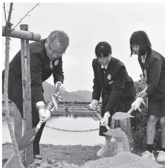
▲豊島区・熊野町ソメイヨシノ記念植樹(坂面大池周辺に植樹しました)