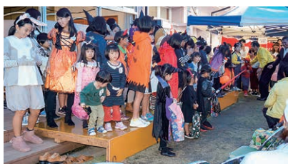
▲フードフェスタではハロウィン大会に多くの参加者が

Q 今後の活動についてお話を伺いました。 A 春には桜や芝桜、つつじ。5月には沢山の鯉のぼりが気持ちよさそうに泳いでいます。熊野東ふれあい館（旧熊野町東部地域健康センター）と深原地区公園の風景です。