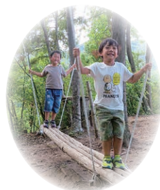
▲人気の手作り遊具

Q 活動内容を詳しく教えてください。 A まずは施設の美観づくりです。来園される方が気持ちよく過ごしていただけるよう、気配りの行き届いた快適な景観づく