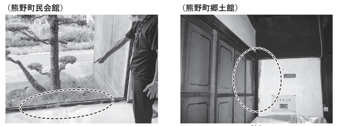
▲雨漏りによる床材劣化のため早期防水工事を要望。(ふでりんホール楽屋入口通路付近)