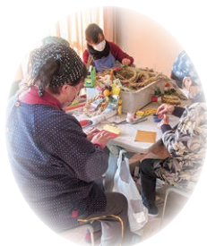
▲年末のしめ縄づくり