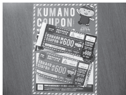
▲熊野町地域経済応援クーポン券【イメージ】