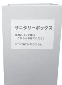
▶ペーパーサンタリーボックス

【A2】 役場庁舎をはじめ、17施設に59か所の男性個室トイレがあり、多くの方が安心して利用できる公共施設の環境づくりをしていくためには、検討する必要があると考える。