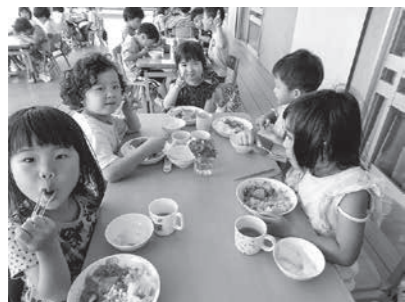
▲くまの・みらい保育園