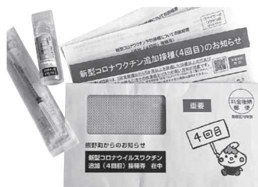
▲新型コロナウイルスワクチン通知(4回目)