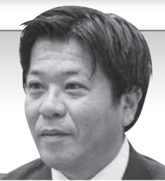
尺田 耕平 議員

〔Q1〕 厚生労働省のひきこもり支援事業では、平成30年度より市町村においてひきこもりサポート事業として、ひきこもり支援基盤を構築し、社会参加に向けた支援を図るため、相談窓口の周知や実態把握、居場所づくり、ひきこもりサポーターの派遣等を行っているところがあるが、実施状況は。