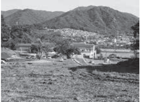
▲整備予定地から筆の里工房を臨む