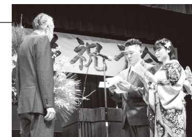
▲昨年の「二十歳を祝う会」の様子

☎教育総務課社会教育グループ(町民会館内) ☎854-3111 ☒shakai@town.kumano.lg.jp