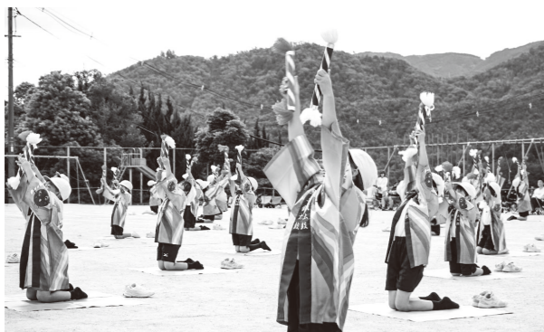
▲銭太鼓の披露の様子

さわやかな風が吹く中、初めての5月開催の運動会を無事に終えることができました。「わたしのわくわく」を届けるべく、入学して間もない1年生も、最高学年としてちょっぴり緊張した表情の6年生も、仲間と励まし合いながら約1ヵ月の練習を続けてきました。昨年までは10月に合わせて練習をしてきた銭太鼓。踊りが難しくなる学年も初めてばちを握る1年生も、曲に合わせて一生懸命練習しました。1つ上の学年のお兄さんお姉さんがていねいに教えてくれたおかげで、当日は全学年息ぴったりの銭太鼓を披露することができました。 また今年は、児童全員参加の応援合戦を来賓の方に採点していただきました。保護者・地域の方の温かい拍手に応えるように、赤組も白組も体をいっぱい使って応援する姿を通して、「2小最強の絆」をみんなに届けることができました。この「最強の絆」をこれからの学校生活に生かしていきます。