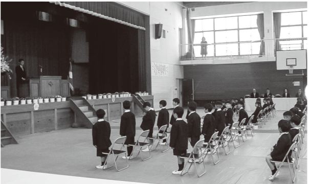
▲入学式の様子

熊野第四小学校 4月8日(水)、桜の咲いた穏やかな天候の中、36人の1年生が入学しました。5・6年生の児童は前日から張り切って会場準備を行い、みんなが1年生の入学を待ち望んでいました。受付で緊張しながら自分の名前を言った1年生は、6年生に優しく案内されて着席し、少し戸惑いながらも一生懸命式の練習を行って、静かに開式を待ちました。式が始まり、担任の先生に名前を呼ばれると「はい。」と大きな声で返事をしたり、来賓からのお祝いの言葉に「ありがとうございます。」と元気に返事したりして、無事に入学式を終えることができました。今年度は1学級となり、みんなが一つの教室で、にぎやかに小学校生活を始めていきます。 明るく元気な熊四っ子の一員として、「ともに伸びる」をモットーに、同級生の友達や上級生のお兄さんやお姉さんとたくさん学び、たくさん遊んで、みんなと仲良く、楽しい毎日を過ごしていきましょう！