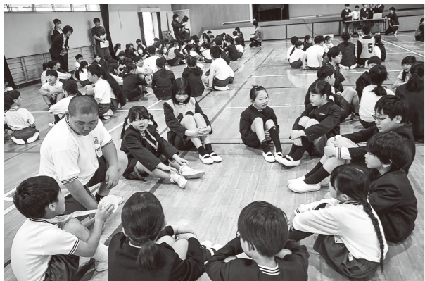
▲輪になって自己紹介をし合う児童たち (教育総務課)

熊野第三小学校 40人の元気な新1年生が入学し、全校児童275人となり、今年度がスタートしました。そして4月27日(月)に、運営委員の計画・進行による「1年生を迎える会」が行われました。拍手と共に入場した1年生は、とても緊張している様子でした。縦割り班で輪になって、プレゼントを渡したり、自己紹介をしたりしました。はずかしそうな1年生に、上級生は優しく声を掛けていました。その後、学校〇×クイズをしました。5・6年生の運営委員の児童の司会進行がびっくりするほど上手で、みんな大盛り上がりでした。初めは緊張していた1年生も、だんだん慣れてきて、たくさんの笑顔が見られました。これからこの縦割り班の仲間で、縦割り掃除をしたり、ロング昼休憩に遊んだりします。 異学年の人とも仲良くなって、今年度の本校の合言葉である「やったあ!!」「すごいね!!」があふれると嬉しいです。